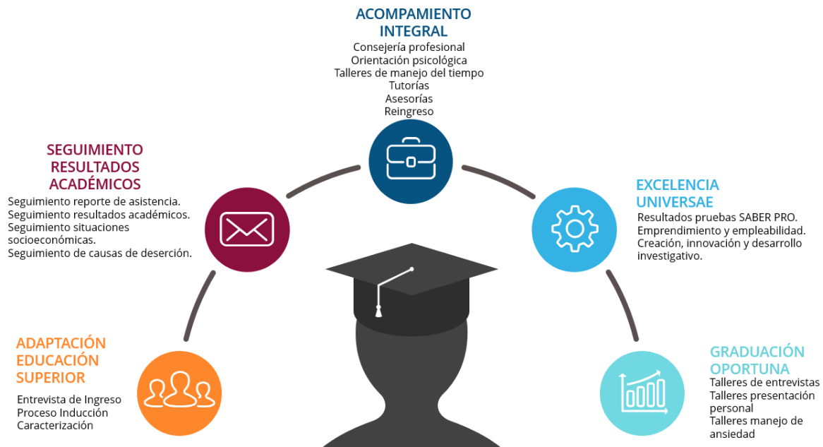
Ilustración 7 Estrategias del eje de permanencia y graduación

Estas estrategias buscan promover la permanencia y graduación exitosa de los estudiantes, brindando apoyo académico, personalizado y recursos necesarios para