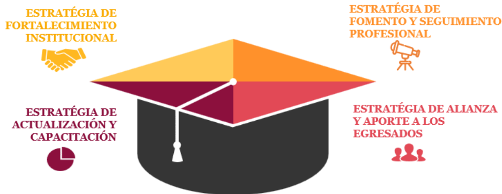
Ilustración 8 Estrategias del eje de seguimiento a egresados

UNIVERSAE Institución de Educación Tecnológica Internacional