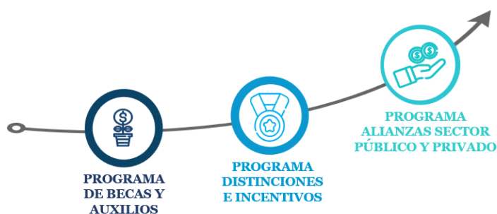
Ilustración 6 Estrategias del EJE de promoción socioeconómica

Estas estrategias buscan promover la promoción socioeconómica de los estudiantes, egresados, docentes y personal administrativo, brindando apoyo, orientación y recursos para su desarrollo profesional y empresarial. Al implementar estas estrategias, se busca facilitar la inserción laboral, fortalecer las competencias socioeconómicas, crear oportunidades de empleo y desarrollo profesional.