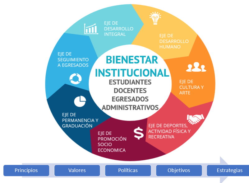
Ilustración 1 Modelo de Bienestar Institucional

El modelo de bienestar institucional contempla el apoyo a los procesos de mejora de la calidad de vida de los diferentes involucrados en el proceso de formación. Al ofrecer programas de salud y bienestar, acceso a servicios de apoyo emocional y promoción de un equilibrio entre el trabajo y la vida personal, se contribuye al bienestar general. Dando como resultado un impacto positivo en la satisfacción, el bienestar mental y físico, la productividad de los estudiantes, egresados, personal administrativo y docentes.