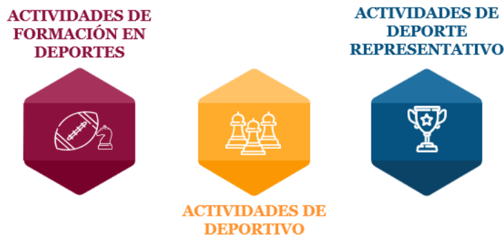
Ilustración 5 Estrategias del eje de deportes, actividad física y recreativa

Estas estrategias buscan promover la participación en actividades deportivas, actividad física y recreativa, fomentando un estilo de vida saludable y el bienestar general de los miembros de la comunidad educativa. Al implementar estas estrategias, se busca proporcionar oportunidades para la práctica de actividades físicas, promover la competencia sana, el espíritu deportivo y el disfrute del tiempo libre, y mejorar la condición física y la salud de los participantes.