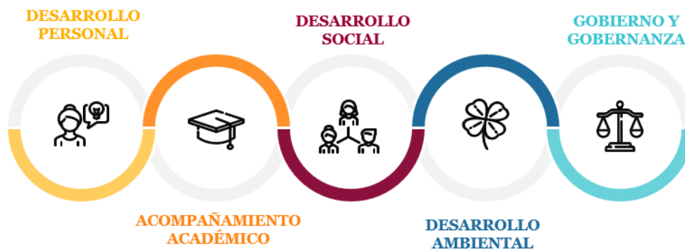
Ilustración 3 Estrategias del EJE de desarrollo humano