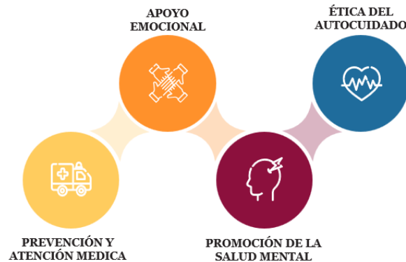
Ilustración 2 Estrategias del eje de salud

Estas estrategias buscan promover la salud integral y el bienestar de los integrantes de la Institución, abordando aspectos físicos, emocionales y preventivos. Al implementar estas estrategias, se busca crear un ambiente saludable, seguro y propicio para el crecimiento académico y personal de los estudiantes, docentes, egresados y personal administrativo.