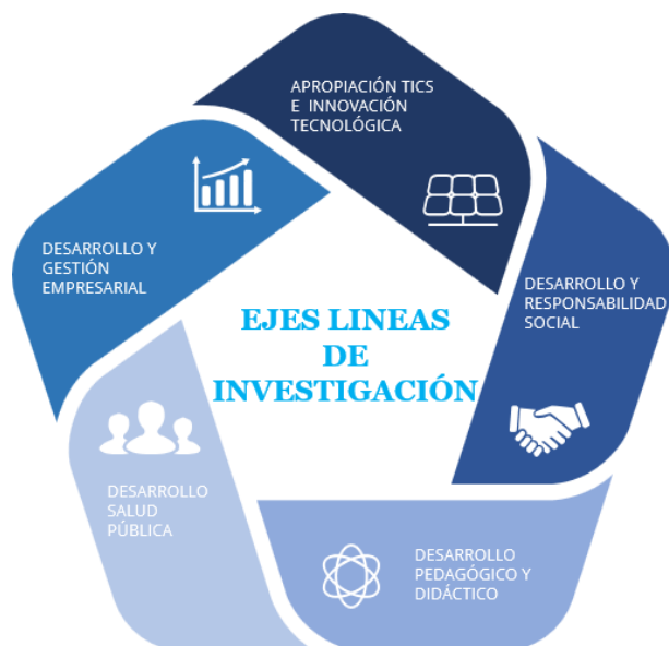
Ilustración 3. Ejes líneas de investigación UNIVERSAE

Son entendidas como ejes articuladores de diversas problemáticas e intereses investigativos en la institución, en las que confluirán, de manera sistemática e intencionada, los proyectos de investigación. Representarán una expresión de la complejidad de la realidad investigativa institucional, tal como se presenta a continuación: