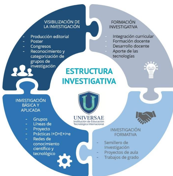
Ilustración 1. Estructura Investigativa

La estructura investigativa se centra en cuatro áreas clave: visibilización de la investigación, formación investigativa, investigación aplicada e investigación formativa. Estos pilares garantizan una sólida base para el desarrollo y la promoción de la investigación en nuestra institución, como se presentan a continuación: